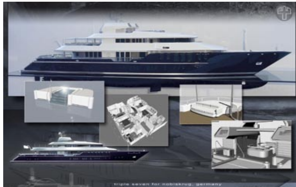
l.oa : 218ft./67.00 m. b.max: 42ft./12.80 m. draught: 12ft./ 3.55 m. speed: 14 - 17 knots. class: gl - full mca

Im Salon befindet sich eine TV-Screen- und Bibliothekkombination. Der an Backbord befindliche große Dining-Bereich, und ein weiterer „En-Suite“ Sofabereich an Steuerbord werden jeweils von grossen Terrassenfenstern umsäumt.